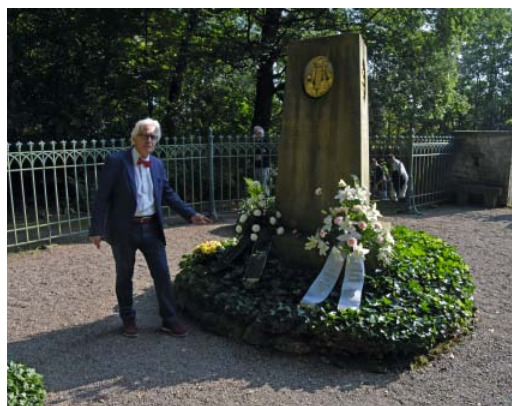
Kranzniederlegung am Grab von Christoph Martin Wieland und anschließende Lesung