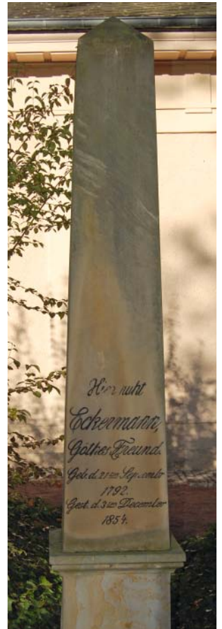
Eckermanns Grab auf dem historischen Friedhof in Weimar